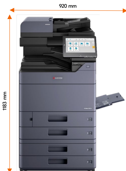
DP-7150 PF-7140 By-pass ouvert