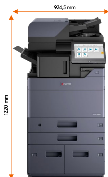
DP-7160 PF-7150 DF-7100 + AK-7110