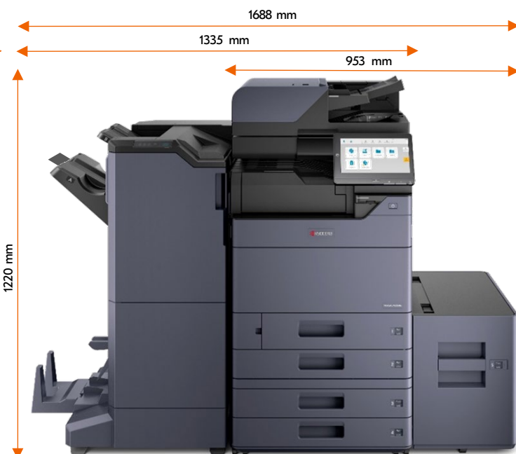
DP-7160 PF-7140 + PF-7120 DF-7140 + AK-7110 BF-730