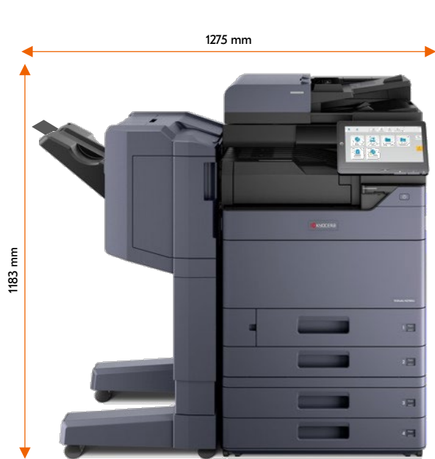
DP-7150 PF-7140 DF-7120